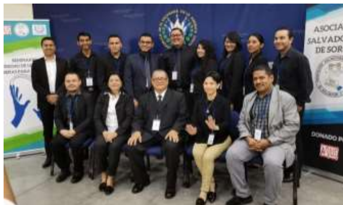
Primera fila sentados: Junta Directiva de la Asociación Salvadoreña de Sordos; de pie, intérpretes de Lengua de Señas Salvadoreña (LESSA).