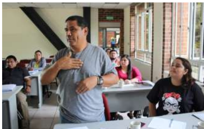
Una de las organizaciones participantes fue la Asociación Salvadoreña de Sordos

De acuerdo a lo establecido en el Art. 27 de la Convención sobre los Derechos de las Personas con Discapacidad, se hace referencia al trabajo y el empleo, desde sus acciones para generar oportunidades de emprendimiento a las personas con discapacidad; es por ello que los Estados Parte a través de las entidades rectoras y ejecutoras, deben promover, proteger e impulsar las micro y pequeñas empresas para incentivar la participación, el desarrollo y la autonomía de las personas con discapacidad.